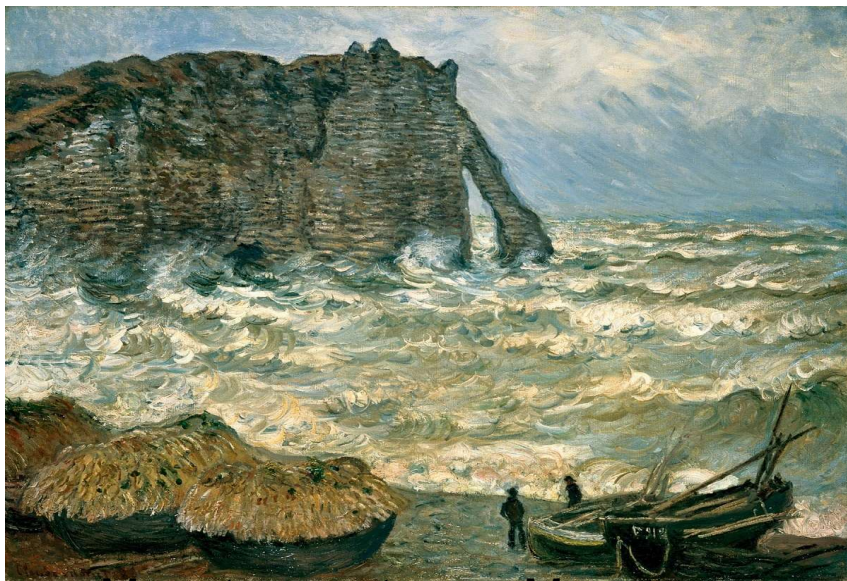
Mare tempestoso – Monet